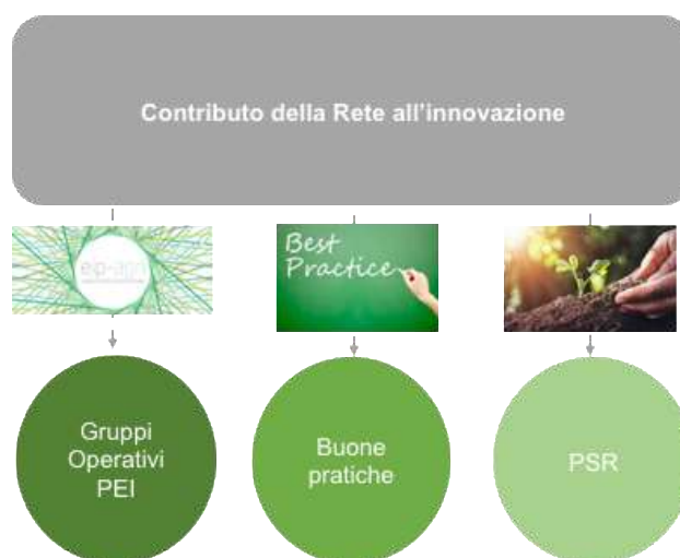
Figura 1- Le 3 componenti dell’Innovazione RRN

Il tema dell’innovazione si pone , infatti, trasversalmente rispetto all’impianto programmatico della Rete Rurale 2014-2020 e informa tutta l’azione del Programma.