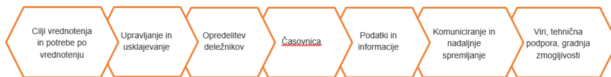
Slika 1 – Minimalna struktura načrta vrednotenja

Vir: Služba za pomoč uporabnikom pri vrednotenju SKP (2023).