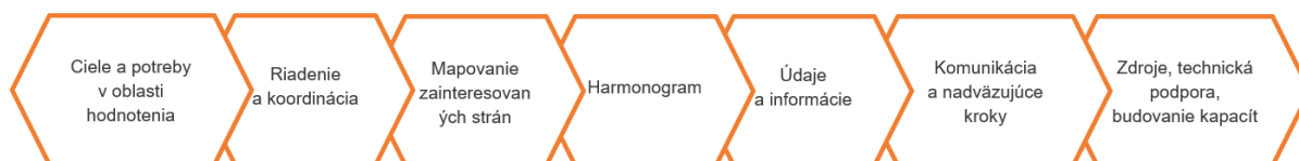
Obrázok 1 – Minimálna štruktúra plánu hodnotenia