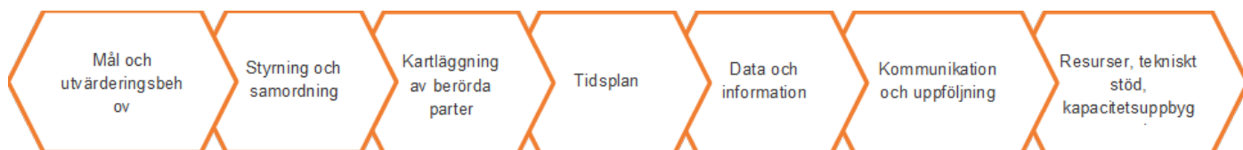
Figur 1 – Minimikrav för struktur för utvärderingsplanen