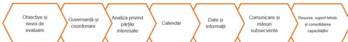
Figura 1 – Structura minimă a planului de evaluare