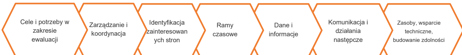
Rys. 1 – Minimalna struktura planu ewaluacji