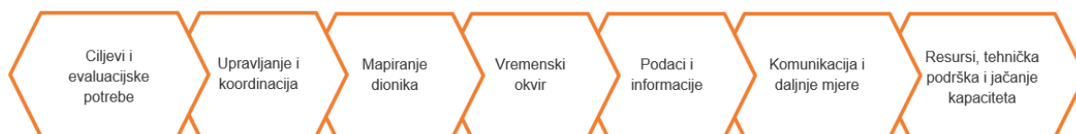
Slika 1 – Minimalni zahtjevi u pogledu strukture plana evaluacije