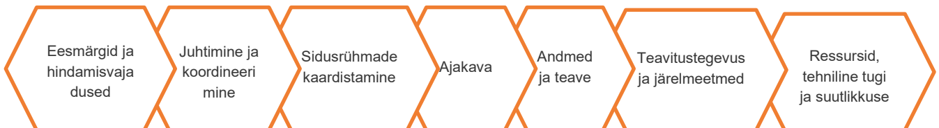
Joonis 1. Hindamiskava ülesehituse miinimumnõuded