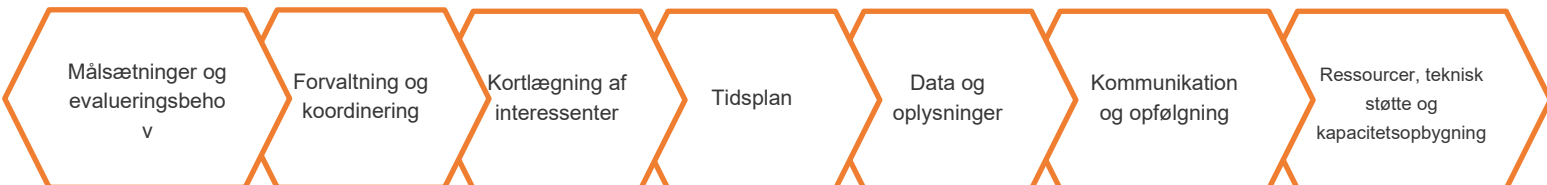
Figur 1 — Minimumskrav for evalueringsplanens struktur

Evalueringsplanens syv afsnit er beskrevet nærmere i de følgende kapitler. For hvert afsnit foreslås minimumsindhold og yderligere indhold. Et afsnit om minimumskravene i henhold til bilag II til forordning (EU) 2022/1475 er anført i en orange boks. Disse retningslinjer indeholder også forslag til yderligere indhold med tilhørende begrundelser. Sammenhængen mellem evalueringsplanens afsnit beskrives også i detaljer og med oversigten i figur 2 nedenfor.