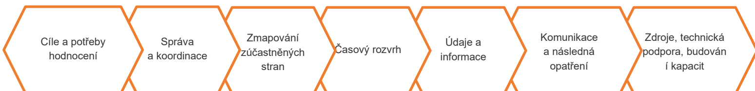
Obrázek 1 – Minimální struktura plánu hodnocení