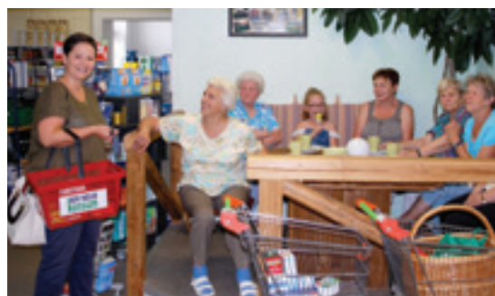
© The new cooperative store at Ballstädt

Sklep, który obsługuje 70–110 klientów dziennie, jest samowystarczalny finansowo i zapewnia trzy ekwiwalenty pełnego czasu pracy. Członkowie spółdzielni