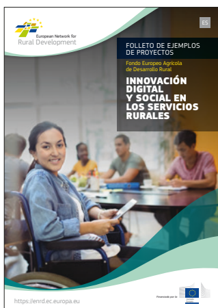
Innovación digital y social en los servicios rurales