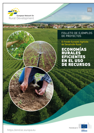
Economías rurales eficientes en el uso de recursos