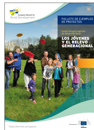
Los jóvenes y el relevo generacional