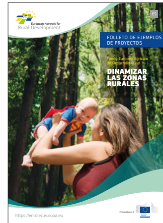
Dinamizar las zonas rurales