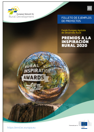
Premios a la Inspiración Rural 2020