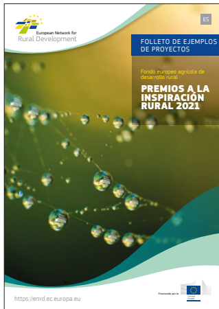
Premios a la Inspiración Rural 2021