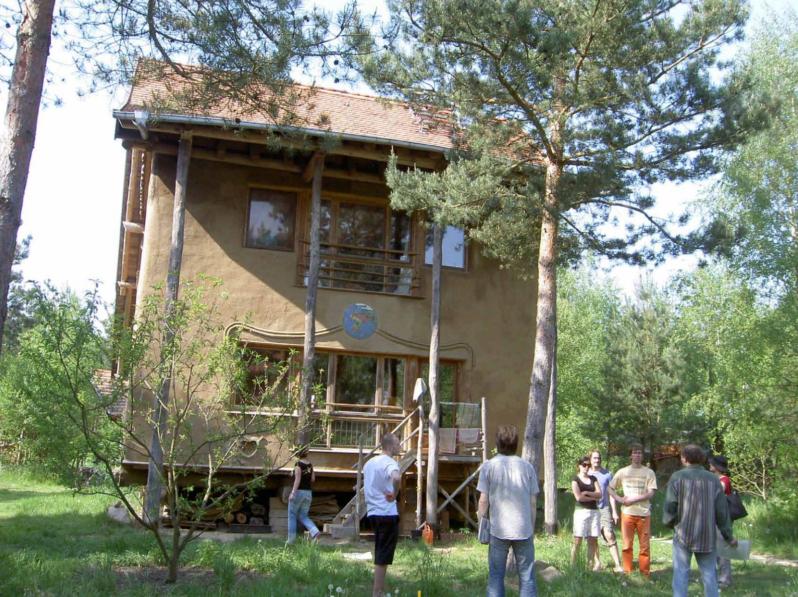
Ręcznie wykonany dom z bali słomianych w wiosce ekologicznej „Sieben Linden”.

Artykuł zaczerpnięty z rubryki „In Focus” publikacji LandInForm nr 4/2011, publikowanej przez niemiecką KSOW, opisuje, w jaki sposób społeczności zainteresowane alternatywnymi stylami życia, takimi jak alternatywne systemy ekologiczne i życie we wspólnocie, stanowią przeciwwagę do zjawiska migracji z obszarów wiejskich. Artykuł autorstwa Iris Kunze.