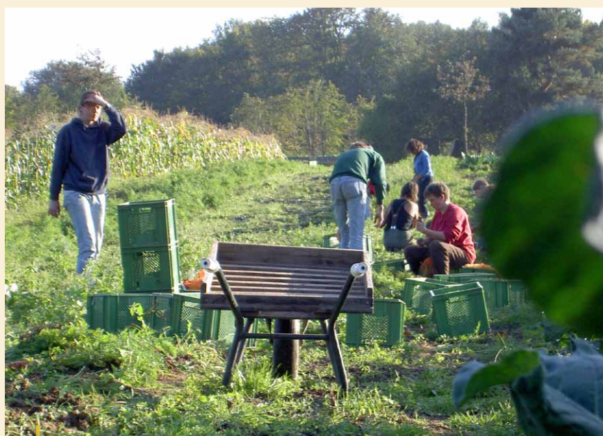
Ogródnictwo według zasad permakultury i eko-odnowy w wiosce ekologicznej „Steyerberg Garden”.

W ten sposób „Ogród życia” stał się lokalnym miejscem spotkań.