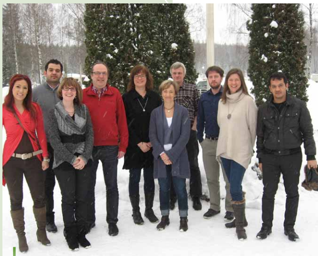
Uczestnicy dzielnie znoszą zimno w Satakuncie.