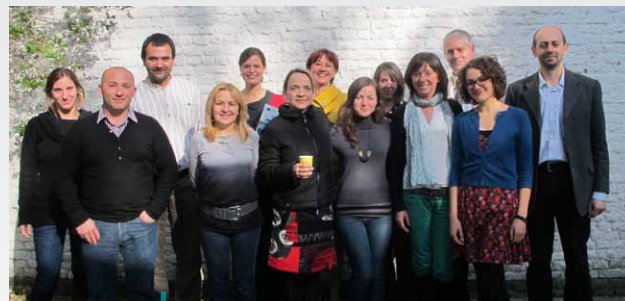
Przedstawiciele JWS z Rumuni razem z pracownikami Punktu Kontaktowego ENRD, Bruksela.

W dniu 19 kwietnia 2012 r., trzech przedstawicieli niedawno utworzonej Jednostki Wsparcia Sieci (JWS) z Rumunii odwiedziło po raz pierwszy Punkt Kontaktowy ENRD. Spotkanie dotyczyło działalności ENRD i możliwości współpracy z innymi krajowymi sieciami obszarów wiejskich (KSOW).