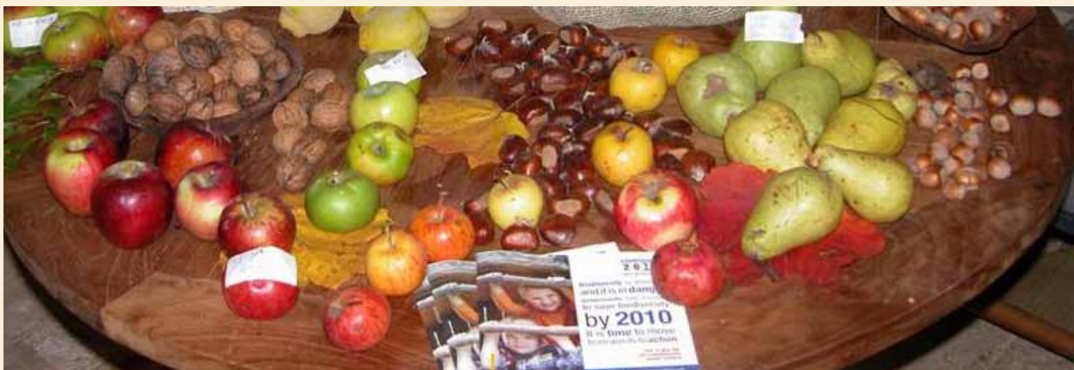
Żywność uprawiana zgodnie z zasadą zrównoważonego rozwoju – część projektu „Dąb pamięci”.

Do upływu terminu składania zgłoszeń otrzymaliśmy ponad 100 kandydatur. Po ewaluacji zaproponowanych projektów jurorzy – specjaliści z dziedzin od kwestii środowiskowych po marketing regionalny, od ewaluacji po kwestie społeczne – przedstawili swój werdykt, wyłaniając projekty najbardziej odpowiadające kryteriom i podzielone na poszczególne kategorie. Kryteria oceny, a tym samym ramy ewaluacji, skupiały się na trzech aspektach: zdolność projektu do osiągnięcia celów rozwojowych obszarów wiejskich (tj. jego efektywność), zrównoważony charakter projektu pod kątem aspektów gospodarczych, społecznych i środowiskowych, a także możliwość transferu przeprowadzonych działań lub osiągniętych wyników.