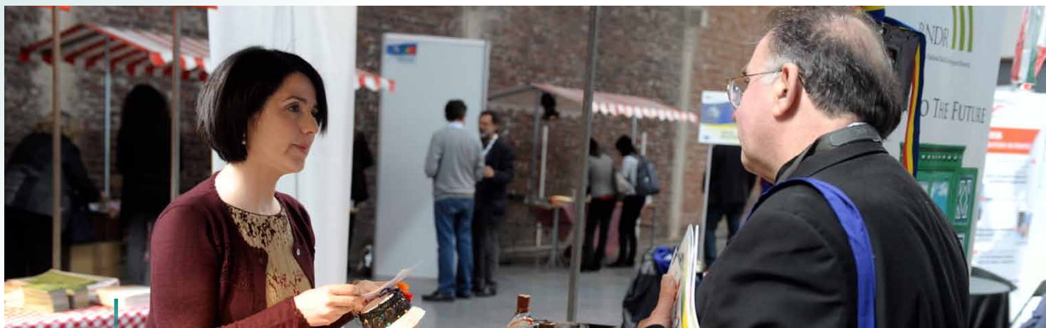
Podczas Spotkania LEADER 2012, uczestnicy byli zainteresowani nawiązaniem współpracy międzynarodowej z zakresu bardzo różnych tematów.