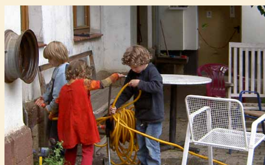
Organiczna uprawa warzyw w wiosce.

Ostatni wspólny projekt nosi nazwę „Elektrownia Mieszkańców Zakątko Lassan” i jest to spółdzielnia z długofalowym celem przekształcenia regionu w region bioenergetyczny.