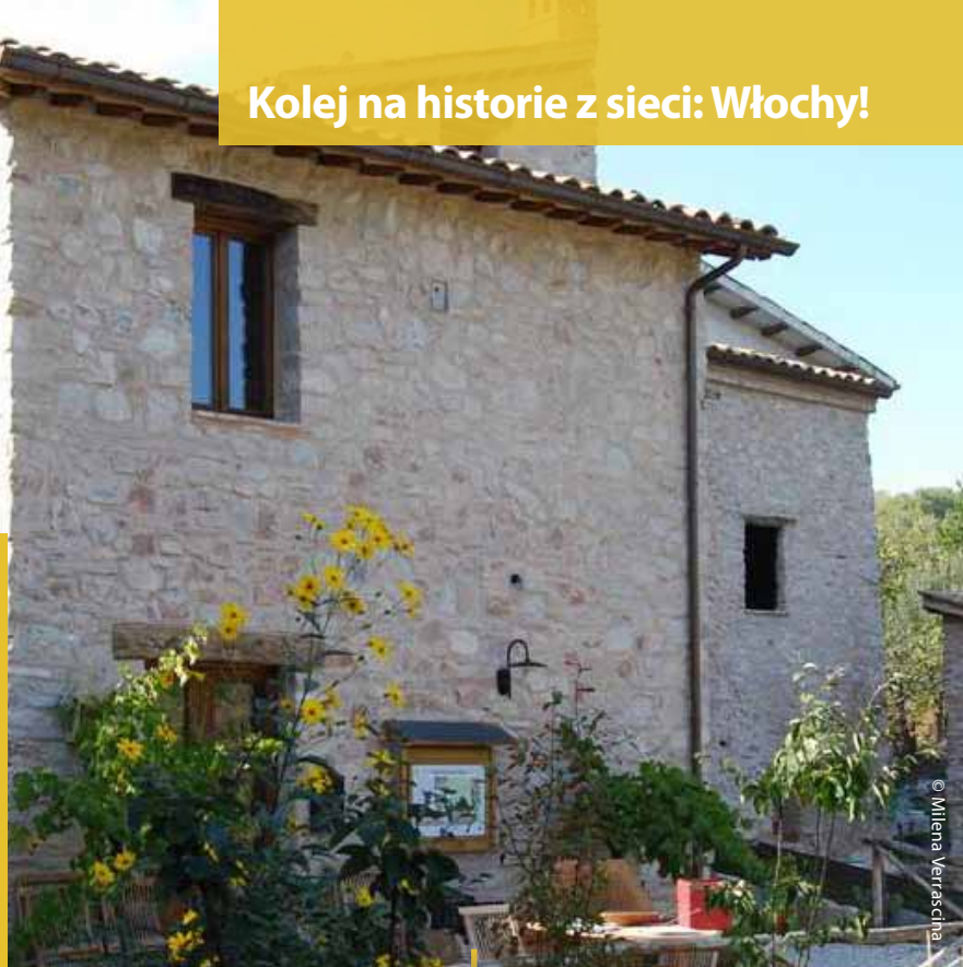
Centrum agroturystyczne projektu „Dąb pamięci”.

A więc teraz kolej na Państwa historie – Włochy, Niemcy i Irlandia Północna!