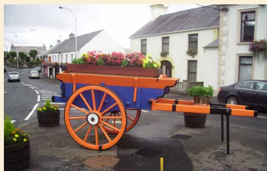
© Rada ds. Rozwoju Obszarów Wiejskich (RDC)

Aileen Donnelly Północnoirlandzka Sieć Obszarów Wiejskich