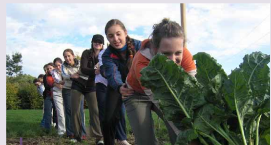
Uczniowie uczestniczą w popularnym programie „Wieś dla szkoły” i podczas wizyty w gospodarstwie ekologicznym zapoznają się z miodem i innymi wytwarzanymi tam produktami organicznymi.

z EFRROW, możliwe stało się poszerzenie działalności gospodarstwa. Wybudowano nowe centrum wystawowe, w którym prezentowane są tradycyjne metody i sprzęt rolniczy; utworzono wybiegi dla zwierząt, gdzie dzieci mogą dowiedzieć się, jak dbać o zwierzęta; a także 60 m 2 pasieki wykonanej z tradycyjnych materiałów, gdzie uczniowie uczą się o pszczelarstwie. Oprócz dywersyfikacji działalności gospodarczej, projekt zapewnił pracę dla wszystkich członków rodziny i pomaga zatrzymać młodych ludzi w regionie. Projekt przyniósł korzyści całej lokalnej społeczności, gdyż powstała nowa atrakcja turystyczna