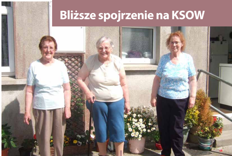
Mieszkańcy lokalnych domów komunalnych w Upperchurch-Drombane.

Rozpoczęte w 2012 roku badanie ma na celu określenie czynników wpływających na potencjał danego obszaru do bycia społecznością samowystarczalną, w tym kluczowe czynniki oraz bariery rozwoju i wzrostu. Raport przedstawia szeroki zakres wyciągniętych wniosków. Przykładowo, jedna z rekomendacji wobec przyszłej polityki rozwoju obszarów wiejskich mówi, że polityka „powinna koncentrować się na zwiększeniu zdolności społeczności do korzystania z zasobów, takich jak żywność, woda, powietrze i energia, w zrównoważony sposób”. Raport z Upperchurch-Drombane jest ostatnim z licznych badań prowadzonych przez KSOW w szerokim zakresie tematów (np. energia odnawialna, rozwój społeczny, rekreacja na świeżym powietrzu, gospodarka odpadami i rolnictwo). Wszystkie studia przypadków mają na celu „analizę i rozpowszechnianie przykładów dobrych praktyk w ramach PROW i stymulowanie innych”. Aby dowiedzieć się więcej, przejdź na stronę internetową irlandzkiej KSOW: http://www.nrn.ie lub kliknij tutaj .