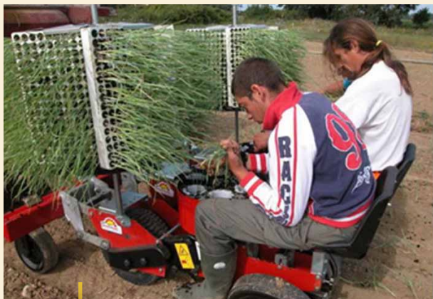
Pracownicy zatrudnieni w projekcie włączającym społecznie „Orti E.T.I.C.I.” – zwycięzcy nagrody w kategorii „Szczególna innowacja”.