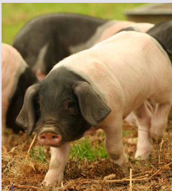
Czarna świnia z Kraju Basków.

Aby obejrzeć krótki film wideo na temat tego projektu, przejdź do galerii mediów na stronie internetowej ENRD .