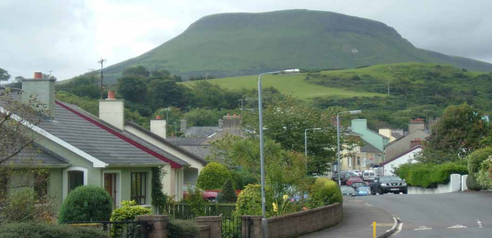
© Rada ds. Rozwoju Obszarów Wiejskich (RDC)