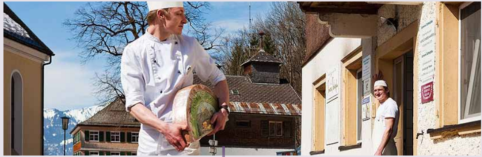
Region Bregenzerwald jest znany z jakości produkowanego tam sera.

Dzięki finansowaniu z EFRROW, w ramach projektu LEADER, którego celem było zwiększenie wartości dodanej lokalnie produkowanego sera, udało się nawiązać współpracę pomiędzy agencjami turystycznymi i rolnikami, co korzystanie wpłynęło na stan lokalnej gospodarki na obszarach górskich w Austrii.