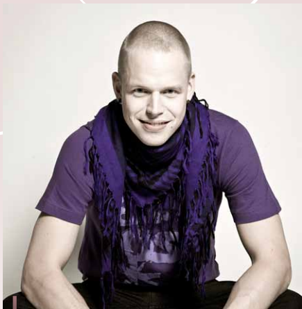
Signmark – niesłyszący fiński artysta hiphopowy, który uczestniczył w wydarzeniu „Małe cuda” promującym rolę sztuki w rozwoju obszarów wiejskich.

Juha-Matti Markkola, koordynator Sieci, powiedziała: „Jesteśmy zachwyceni, że przy organizacji trzeciego seminarium nt. przedsięwzięć kreatywnych, mogliśmy współpracować z tyloma partnerami, w tym z władzami Kaustinen i Kokkola. Uważamy, że ten sektor jest ciągle niewykorzystany jeżeli chodzi o jego rolę w rozwoju gospodarki i odnowie wsi.” Aby dowiedzieć się więcej, przejdź na strony: http://www.rural.fi , http://www.ruralpolicy.fi/en , http://www.creativeindustries.fi , http://www.luovataluuet.fi , http://www.taiteenkeskustoimikunta.fi/web/pohjanmaa/pohjanmaan-taidetoimikunta .