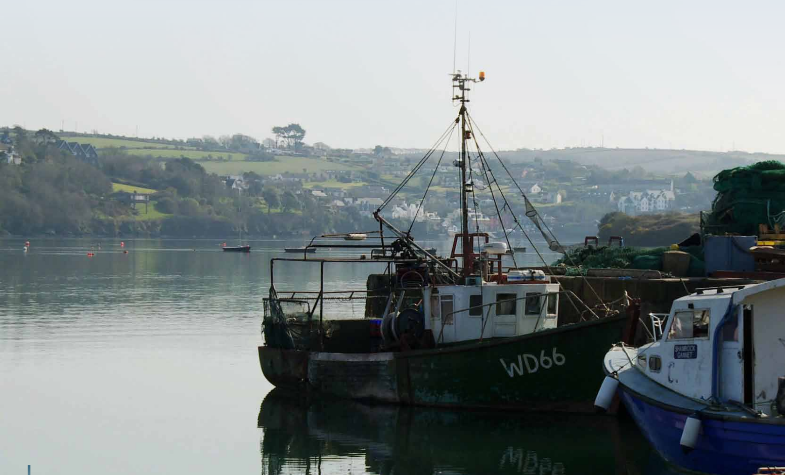
Wioska rybacka w regionie East Cork, Irlandia.

Jest jednak oczywiste, że współpraca w ramach poszczególnych inicjatyw i ich wzajemna komplementarność, będą w przyszłości odgrywać coraz większą rolę. W świetle wyzwań, takich jak konieczność dostosowania do zmian klimatu i niestabilności gospodarczej, współpraca należy do kluczowych narzędzi pozwalających maksymalizować efektywność funduszy unijnych i zapewnić, że obszary wiejskie i rybackie rozwijają się kompleksowo. Ponieważ zarówno Komitet ds. LEADER, jak i Komitet ds. EFR zobowiązały się do wspierania rozwoju kierowanego przez społeczność lokalną, wyzwaniem dla interesariuszy jest tak pokierować tą współpracą, aby osiągnąć dodatkowe korzyści dla poszczególnych programów i jednocześnie nie osłabiać ich kluczowych celów. Strategiczna i organizacyjna współpraca, która uwzględni uwarunkowania poszczególnych obszarów, pozwoli uniknąć nieefektywnego „zestandardowanego” podejścia i uzyskać efekt synergii, który prowadzi będzie po ścieżce rozwoju zrównoważonego.