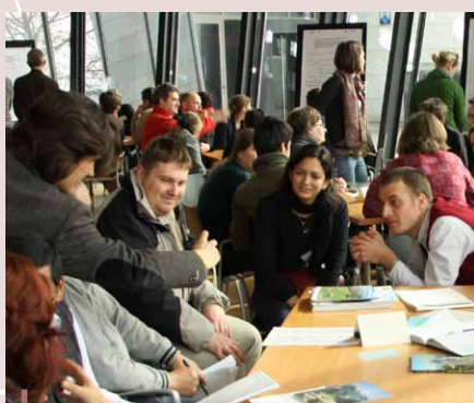
Austriackie warsztaty nt. procesów partycypacyjnych na obszarach chronionych.