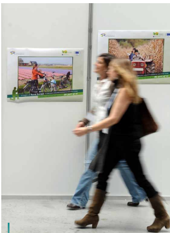
Uczestnicy Spotkania LEADER 2012 spacerują obok wystawy zorganizowanej przez ENRD w ramach konkursu fotograficznego pt. Europejska wieś na zdjęciach.