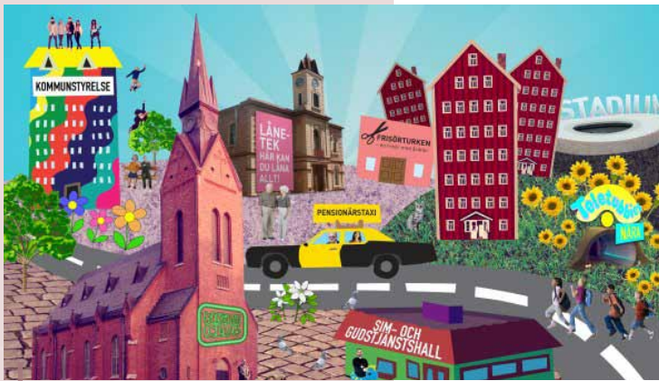
Rozwój obszarów wiejskich według młodzieży zaangażowanej w inicjatywę szwedzkiej KSOW.