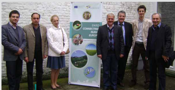
Przedstawiciele bułgarskich lokalnych grup działania wraz z pracownikami Punktu Kontaktowego ENRD, Bruksela.

W dniu 24 kwietnia 2012 r., przedstawiciele pięciu niedawno utworzonych bułgarskich lokalnych grup działania (LGD) odwiedzili Punkt Kontaktowy ENRD, aby dowiedzieć się więcej na temat struktury i roli ENRD oraz podejmowanych działań w związku z LEADER.