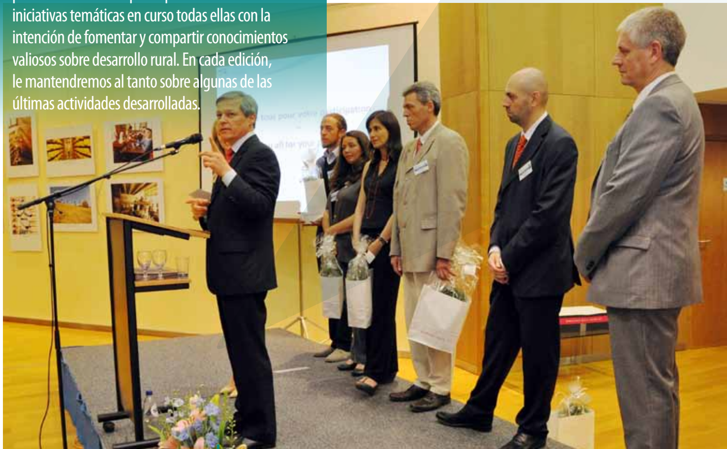
El Comisario de agricultura y desarrollo rural, Dacian Cioloș con miembros del jurado durante la ceremonia de entrega de premios de Imágenes de la Europa rural de la REDR, celebrada en el edificio Berlaymont en Bruselas el 2 de julio de 2012.

La rica diversidad de la Europa rural quedó reflejada en la ceremonia de entrega de premios del concurso de fotografía Imágenes de la Europa rural que se celebró el 2 de julio en el edificio Berlaymont en Bruselas. A la ceremonia, presentada por el comisario de agricultura y desarrollo rural, Dacian Cioloș, acudió gente de las comunidades locales de toda Europa para homenajear la diversidad de las zonas rurales.