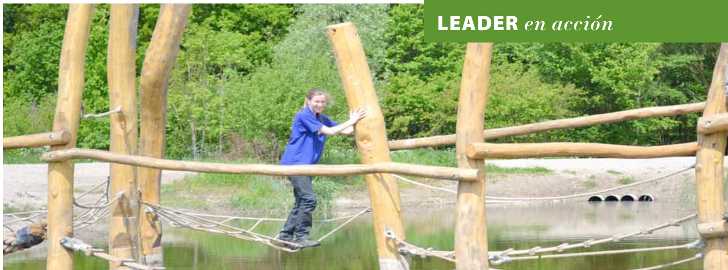
Área de juegos en el parque de aventuras Belevenissenbos.