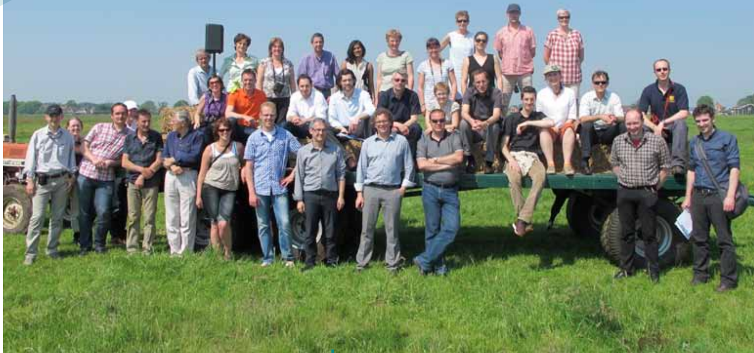
Reunión de Grupo de enfoque en Purmerend, Holanda con ocasión de su segunda reunión en mayo de 2012.