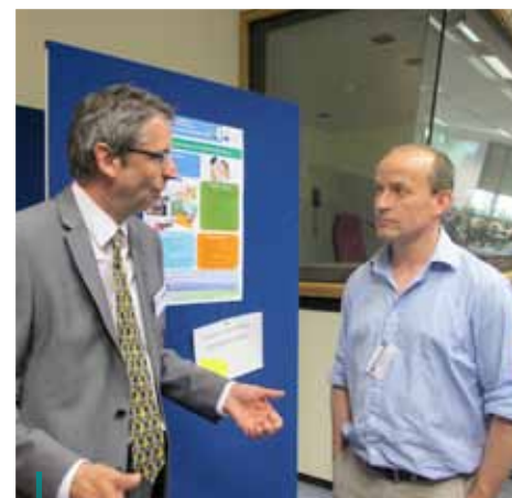
Un debate sobre Estrategias de desarrollo local durante la reunión del Subcomité LEADER celebrado en Bruselas en mayo de 2012.