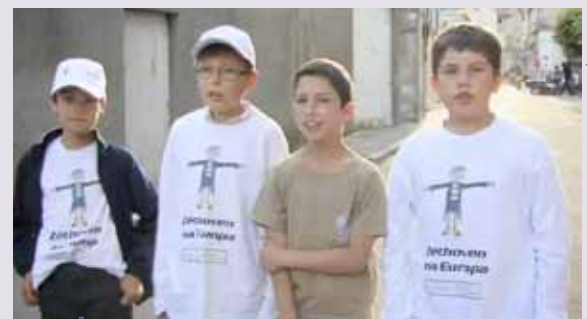
Niños de Pays Sud-Charente en Francia después de su actuación Zethoven en el Festival nacional de música francés el 21 de junio de 2012.