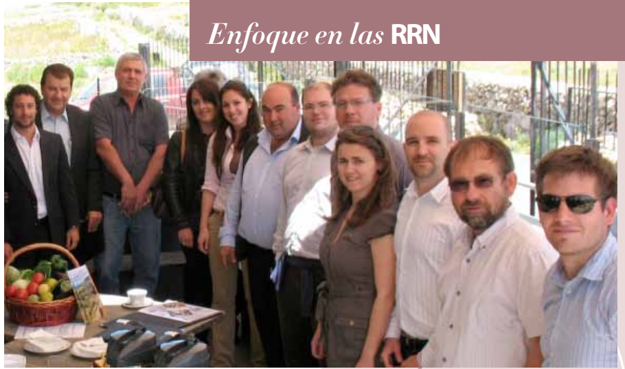
El nuevo comité de la RRN de Malta.

El comité, el cual tiene una gran amplitud de miembros de los sectores agrícola, medioambiental y artesanal además de representantes de GAL y del gobierno debatieron la consulta patrocinada por la RRN sobre el periodo posterior a 2013. Además de realizar consultas entre los participantes y un análisis presupuestario, la RRN también estableció seis grupos de trabajo, cada uno se centrará en desarrollar uno de los temas propuestos para el PDR 2014-2020. En la reunión, a la cual asistieron evaluadores independientes para el Programa de desarrollo rural (PDR) para el periodo 2007-2013, también se presentaron actualizaciones de tres GAL (Xlokk, Majjistral y Gozo) y debatieron iniciativas de comunicaciones de la RRN. El nuevo comité de la RRN se reunirá cada cuatro meses y esto coincidirá con la publicación de un boletín en línea, cuya última edición trata sobre energía renovable y agricultura. Para obtener más información visite https://secure2.gov.mt/MRRA-MA/home?l=1 .