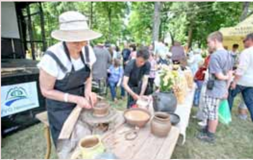
Una alfarera del GAL Nemunas.

La RRN lituana reunió a 30 GAL lituanos con representantes de otros 13 países miembros en la región Panemuniaí en mayo de 2012, para ofrecer una exposición de lo mejor en desarrollo rural, ilustrado mediante el patrimonio culinario y las artesanías tradicionales. Representantes de GAL y RRN de países como Finlandia, Polonia, Letonia, Gales (Reino Unido), Chipre, Estonia, Portugal y Bulgaria celebraron la reunión donde se discutieron varios proyectos de Cooperación transnacional (CTN). El evento se celebró al mismo tiempo que el festival anual Panemuniaí Blossom el cual atrae a miles de visitantes de toda Lituania. Los participantes también disfrutaron con la actuación de grupos de danza populares, cuenta cuentos y grupos de jóvenes en el festival y expresaron su apreciación por la fuerte identidad cultural que se ha mantenido en Lituania. Para obtener mayor información visite www.kaimotinklas.lt .