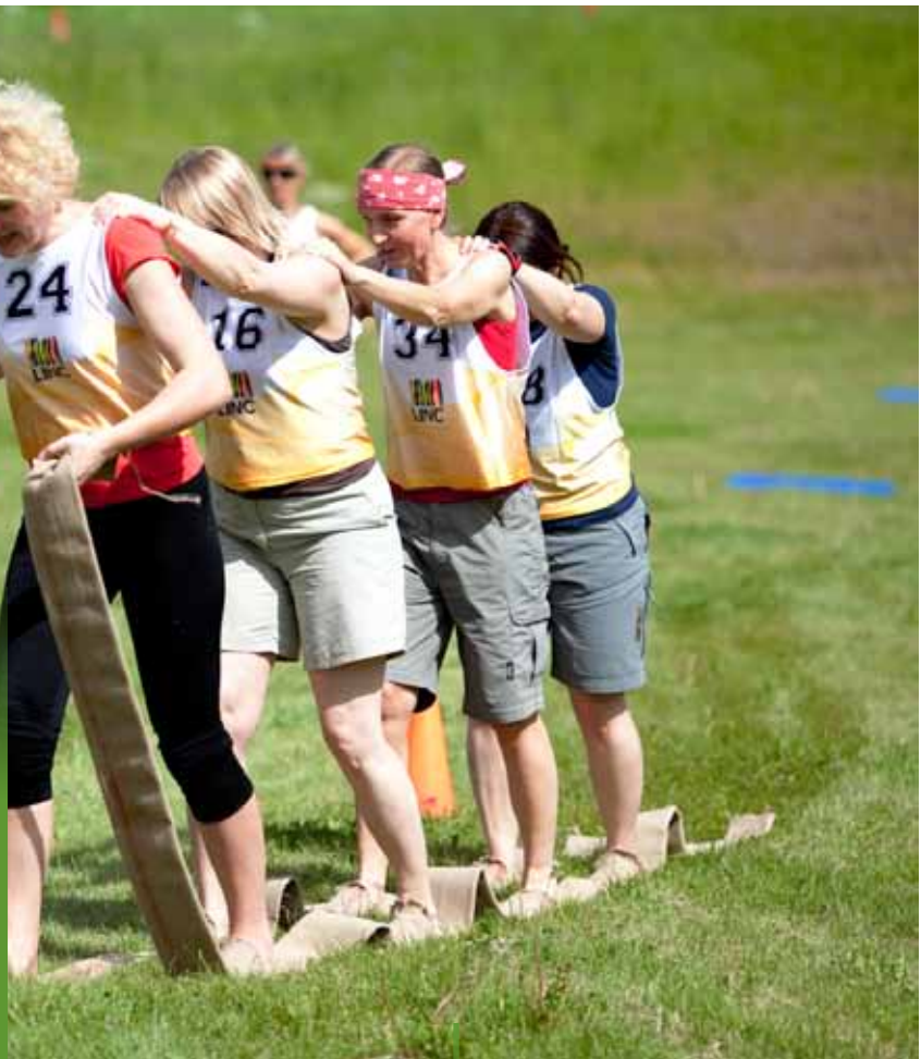
El inusitado esquí de verano en Mammaste.

Los grupos de acción local (GAL) son asociaciones locales público-privadas que trabajan para fomentar el enfoque ascendente de LEADER hacia el desarrollo rural en la UE. Esta sección ofrece algunas de las actividades y eventos realizados por los GAL que han tenido lugar recientemente.