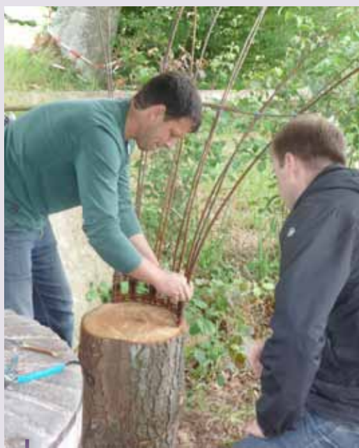
Fabricación de asientos de mimbre durante un taller creativo en un molino en Beckerich.

Los animales están ahora más sanos que antes de la introducción del cambio de gestión. En consecuencia, han aumentado la producción de leche y la fertilidad. Como consecuencia se ha reducido el uso de los combustibles basados en el petróleo y la empresa en general es más viable.