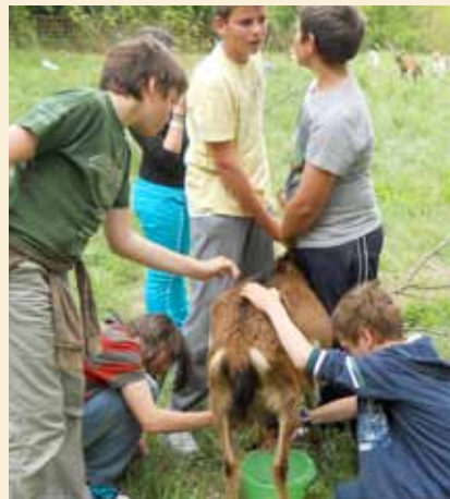
Unos niños aprenden a ordeñar cabras.

miembros del grupo agrícola también han aprendido a tejer.