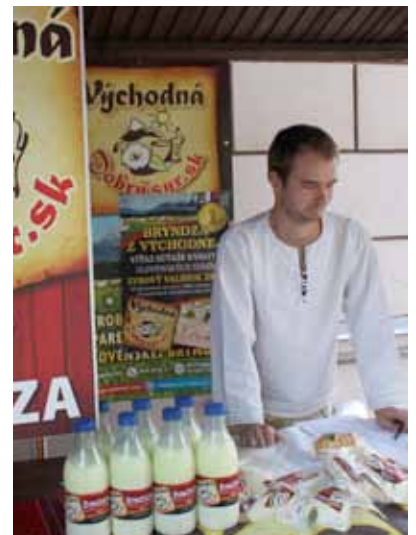
Un puesto de productos locales en el LEADER-FEST.

En total, alrededor de 250 delegados de 11 países asistieron al evento, el cual se centró en aplicar una estrategia integrada para la implementación del método LEADER posterior a 2013. Se celebraron talleres sobre temas como la economía verde, productos locales y servicios, participación de jóvenes y turismo rural. Además, los GAL expusieron artesanía local y alimentos en un mercado y el evento también proporcionó un amplio programa folclórico y cultural, el cual contó con más de 430 miembros de grupos folclóricos y 50 artesanos.