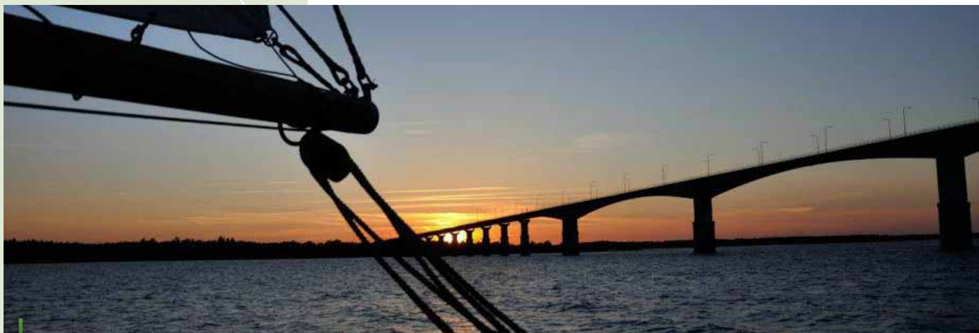
Ihana y el puente Ölands, Suecia.