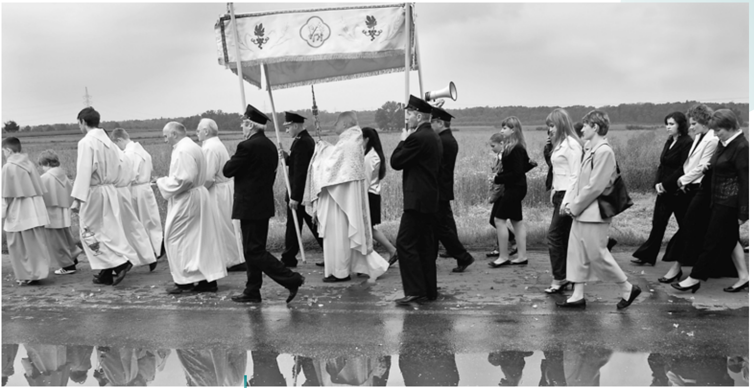
'Belief and Tradition' por Jacek Cisło de Polonia (GAL Ziemia Pszczyńska), ganadora del tercer premio en la categoría Gente rural.

“Oí hablar sobre el concurso en mi comunidad y decidí presentar mi foto de Lonetal, ya que me trae recuerdos de mi infancia. La Europa rural tiene muchas caras y esta fotografía retrata el misterio de esta preciosa parte de Alemania, espero que esta fotografía anime a la gente a visitar mi zona”,