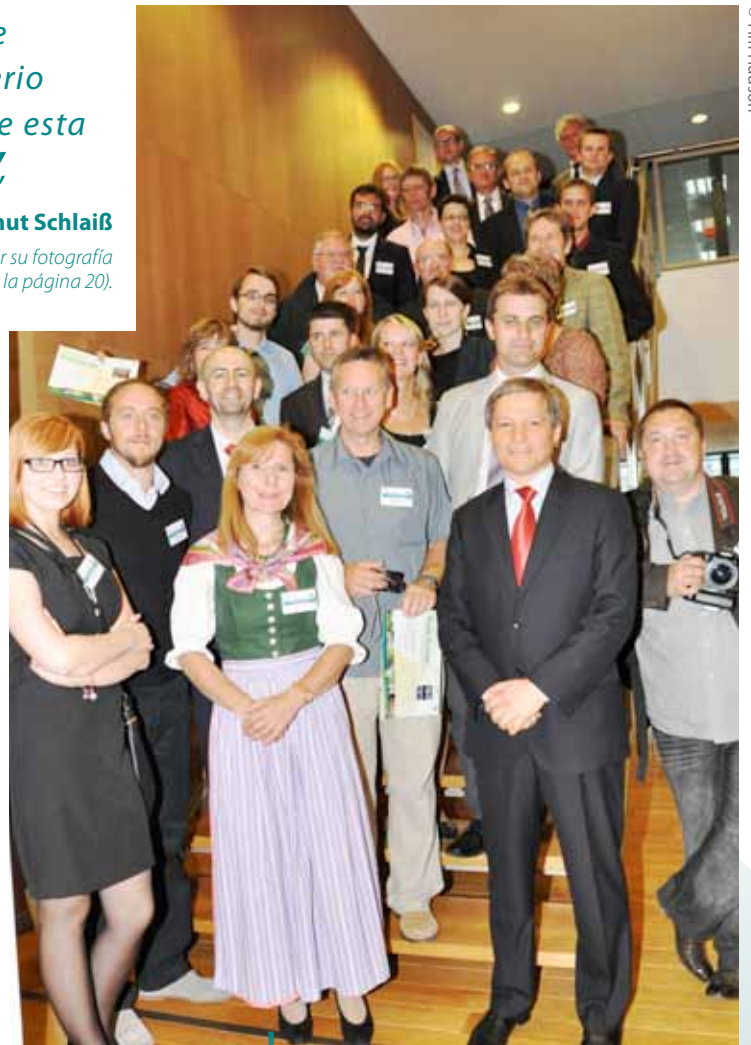
Fotógrafos ganadores y representantes de GAL con miembros del jurado y el Comisario Ciolos.

Tras la ceremonia se expuso una selección de fotografías en la Galería Presidents del edificio Berlaymont. Más adelante, y durante 2013, está previsto realizar una exposición itinerante, lo que permitirá que más gente disfrute de las fotos en otros lugares de Europa.