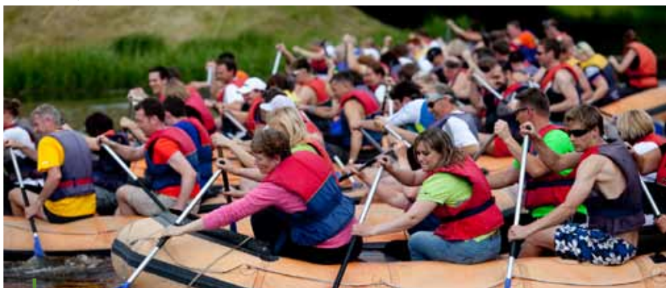
El concurso de remo en el lago Põlva.

Para obtener más información visite www.info-linc.eu/eng o www.tas.ee .