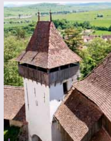
El pueblo de Viscri es mejor conocido por su iglesia fortificada, originalmente construida alrededor de 1100 y designada Patrimonio de la humanidad por la UNESCO en 1993.

Con el apoyo de 200.000 euros del FEADER compraron y convirtieron dos casas de invitados, que ofrecen alojamiento, pequeñas salas de conferencias, productos alimenticios de alta calidad y servicios turísticos. Su objetivo era convertir las granjas sajonas mientras permanecen fieles a la arquitectura y distribución tradicionales. Su idea es desarrollar actividades rentables, de modo que el patrimonio rural como un producto turístico de excelencia forme parte de una manera de apoyar a la comunidad rural y el estilo de vida tradicional.