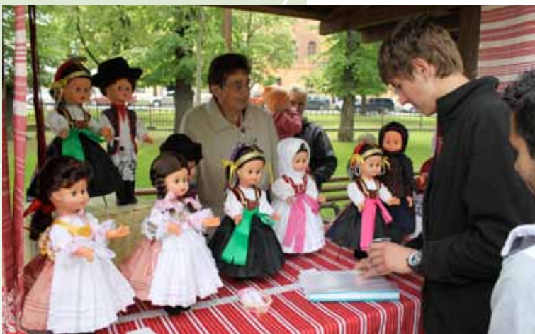
Un puesto de artesanía en el LEADER-FEST.

Para obtener más información visite www.maslev.sk y www.nsr.sk .