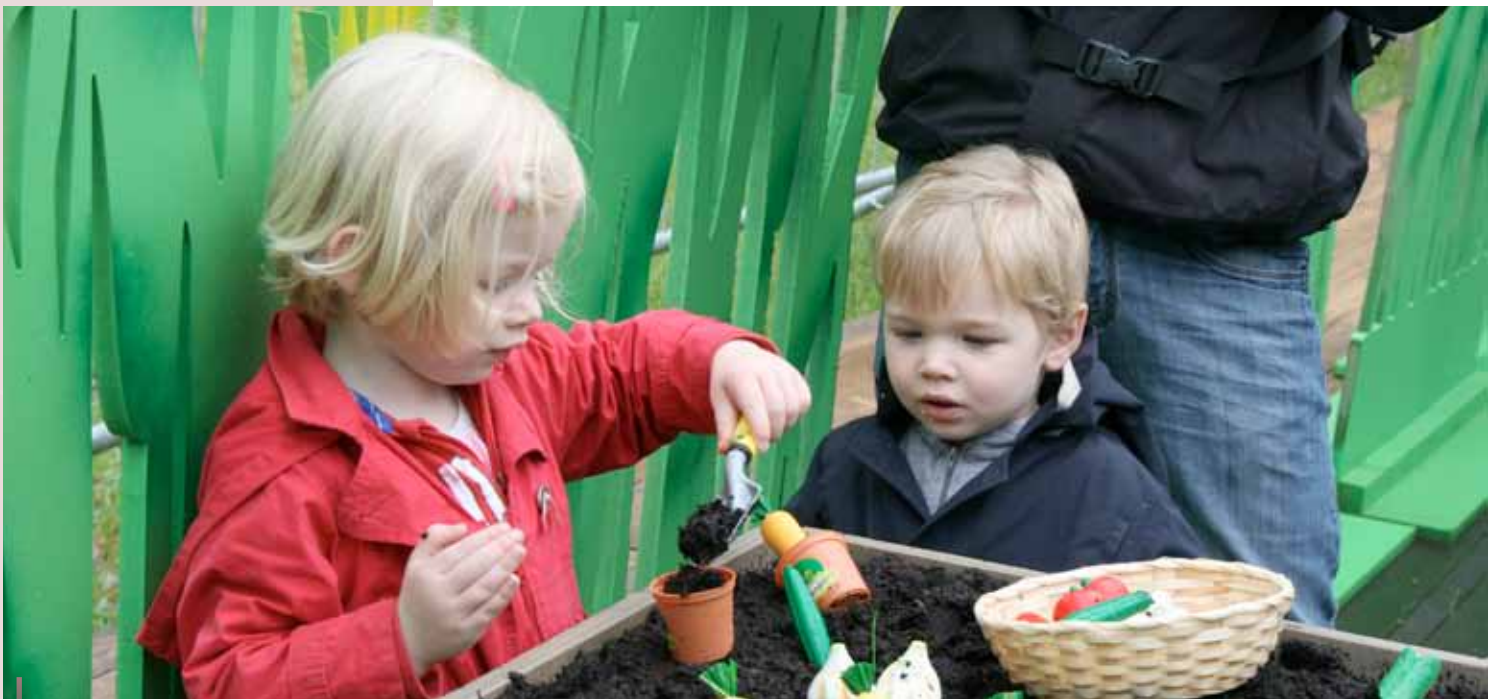
Varios niños disfrutan con los placeres de cultivar sus propias verduras.