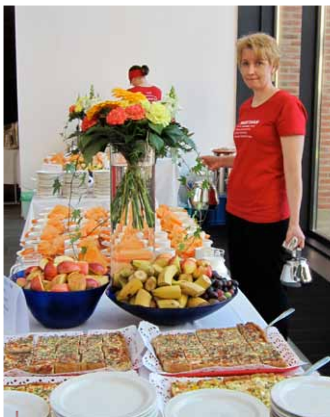
Algunos de los alimentos frescos que se sirvieron durante la conferencia Lo rural en la vanguardia.

Para obtener mayor información visite www.mua.fi/ruralattheedge/