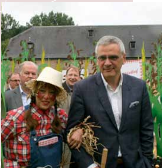
El Primer Ministro de Flandes, Kris Peeters, inaugura la exposición itinerante entrando al stand con un espantapájaros.

Para obtener más información visite www.rndr.ro .