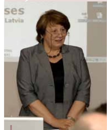
Laimdota Straujuma, ministra de agricultura letón, se dirige a los conferenciantes.