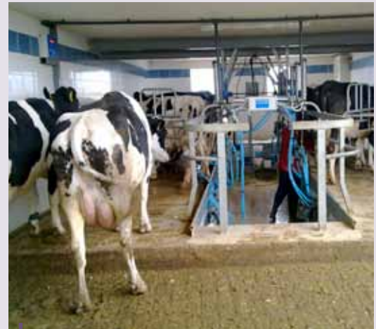
Medida 124 – Mejora de la eficacia en una explotación lechera maltesa.

alrededor de 81.913 euros permitió a los proyectos crear procesos y tecnología que determinen la composición química y el valor nutritivo de los comestibles. Se adquirió equipo especializado para la investigación y el análisis en laboratorio. Varios expertos en molido de pienso y nutrición participaron en la evaluación de los procesos actuales y ofrecieron recomendaciones para mejorar la calidad del producto. Al desarrollar procesos más eficaces, el proyecto Marsa ha llevado a un aumento general en la calidad de los productos lácteos y a una competitividad más elevada del sector lácteo local.