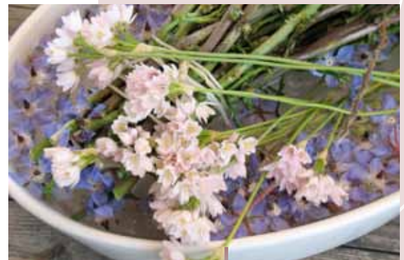
Flores primaverales de Malta.

La RRN letona celebró en asociación con el Equipo de financiación rural de la REDR el seminario "Finanzas y apoyo al empresariado rural" en Riga el 28 de junio de 2012. Al evento asistieron cerca de 70 delegados de toda la UE para considerar varios aspectos sobre las dificultades financieras y cómo estas afectan a las empresas agrícolas.