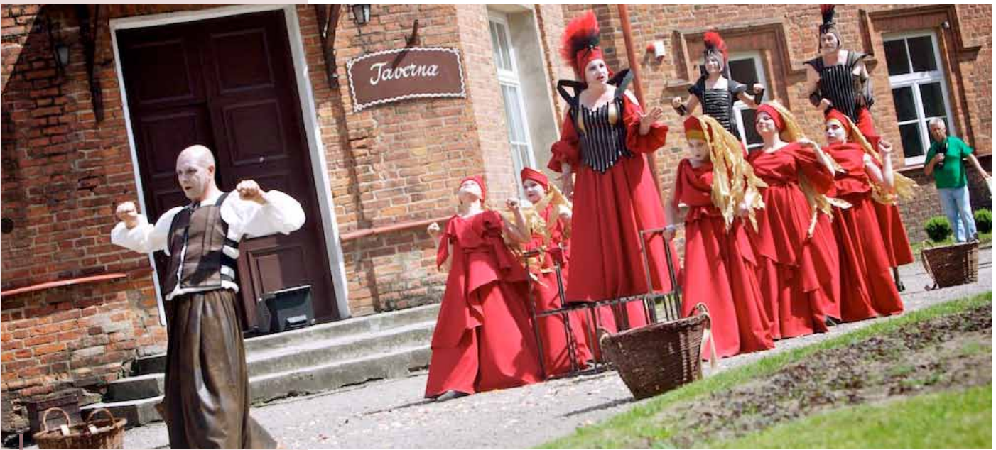
Intérpretes culturales en la Feria GAL internacional