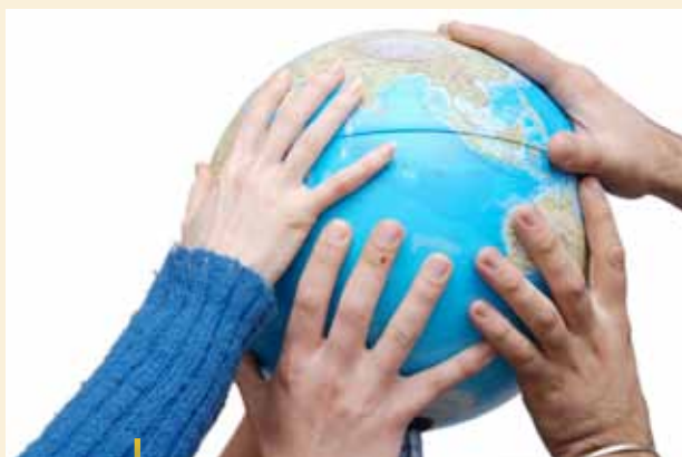
Las opiniones de la juventud deben tenerse en cuenta durante la fase de planificación, según las investigaciones.

opiniones sobre políticas locales que afectan a la gente joven con representantes de los organismos oficiales y asociaciones de los territorios, para sugerir planes que pudieran aplicarse de una manera complementaria y coherente. Además, las nuevas investigaciones también se encaminaron hacia adoptar nuevas ideas que ayuden a los profesionales locales a implementar una "política para la juventud" que pueda llevar a una política global para todo el territorio. Todo este trabajo tuvo como consecuencia la publicación de una herramienta de orientación titulada "La implementación de la política local para la juventud". Esta guía establece que no hay una descripción única de la juventud, sino de hecho muchas clases de jóvenes, dependiendo de si se les cataloga por género, edad, recursos financieros, etc. También representan un sector general del público en relación a una variedad de temas y políticas, ya sea en educación,