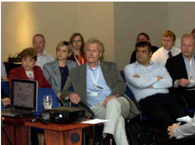
Participantes en la conferencia.

"La financiación para nuevas empresas es un tema importante en toda Europa, y creemos que este seminario es un paso importante al animar a las Autoridades de gestión y a las RRN a considerar la manera en la que los nuevos instrumentos financieros que pueden animar el crecimiento de la economía rural pueden incorporarse en su planificación para el PDR 2014-2020". Para obtener más información visite www.lkkc.lv y http://enrd.ec.europa.eu/themes/entrepreneurship/rural-finance/en/rural-finance_en.cfm .