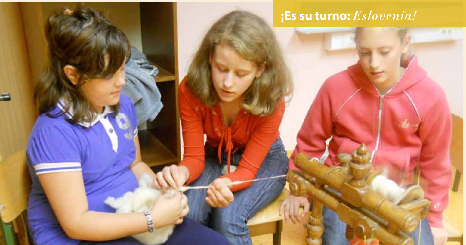
Unas niñas aprenden a trabajar con la rueca.