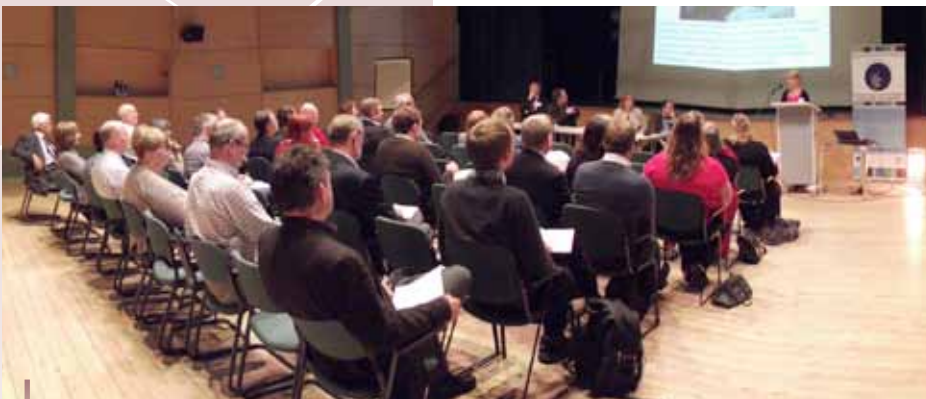
Delegados en el evento de Networking para el transporte comunitario.

(como las iniciativas "llame a un autobús" o "coches comunitarios"), trabajo con voluntarios e información y aplicación de la legislación sobre igualdad de oportunidades. La información recibida de los 42 participantes al evento indica que tras los recortes en los servicios en transporte urbano y el aumento en los costes del combustible el sector del transporte comunitario debe continuar aumentando. Para obtener mayor información visite: www.ruralgateway.org.uk o www.ctauk.org/in-your-area/scotland.aspx .