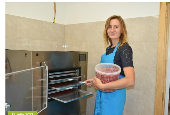
17. jūlijs 2023.