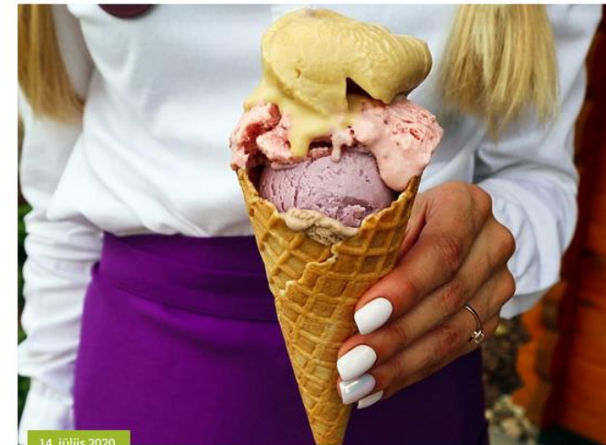
14. jūlijs 2020.